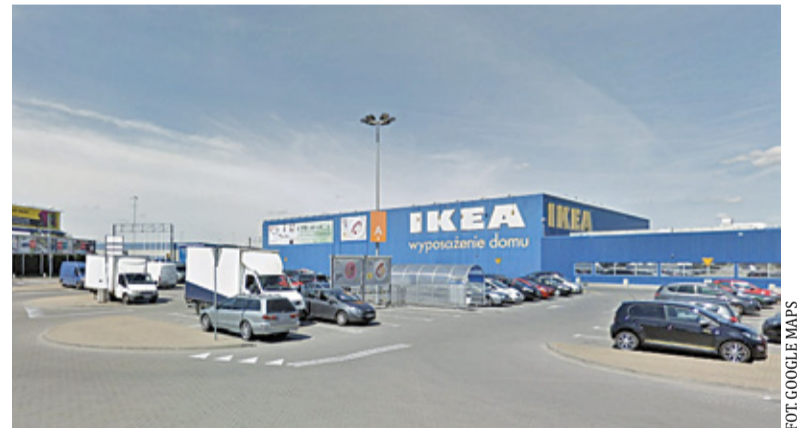
Kasjerki były przestraszone wewnętrznymi karami za obsługę klienta bez maski

– Na miejsce zostali wezwani policjanci, którzy właściwie nic konkretnego ani nie powiedzieli, ani nie zrobili. Bezczyinnie przyglądali się odmowom