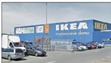
||| Janki - Protest w IKEA s. 2

P R U S Z K Ó W ||| P I A S T Ó W ||| B R W I N Ó W ||| M I C H A Ł O W I C E ||| N A D A R Z Y N ||| R A S Z Y N