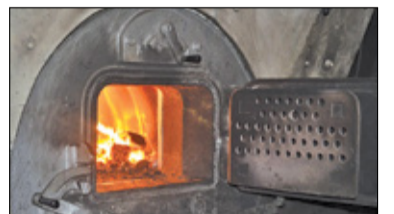
||| Piastów, Raszyn - Dofinansowanie na wymianę pieców s. 6