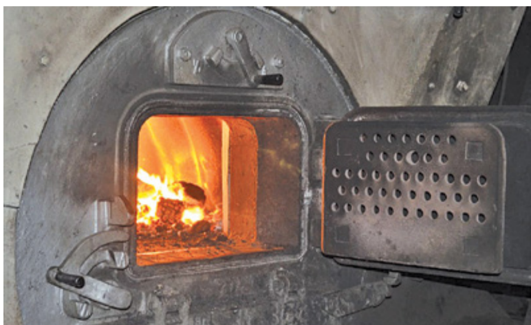
Projekt obejmuje wymianę starych urządzeń grzewczych na kotły gazowe