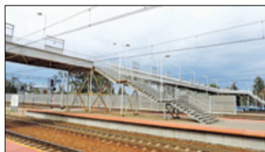
||| Grodzisk Mazowiecki - Najpierw kładka, później winda s. 3