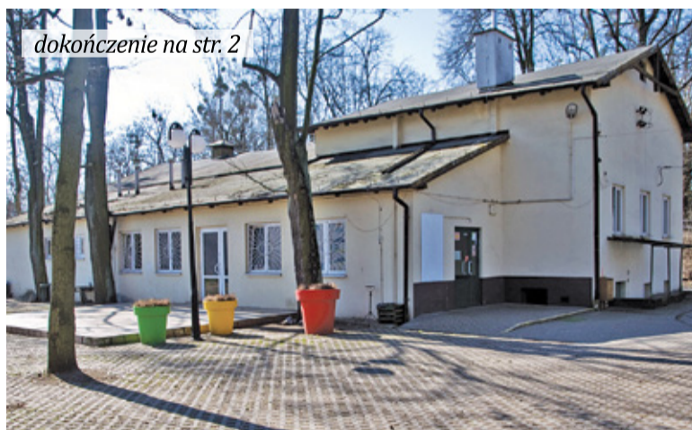
dokończenie na str. 2

Kilka lat temu Teatr Letni wyłączono z użytku z uwagi na katastrofalny stan budynku