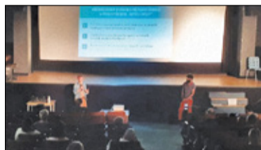
||| Piastów - NewCity, czyli nowa jakość s. 5