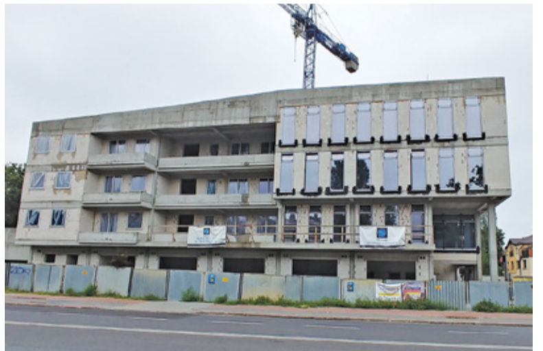
Budynek przy al. Armii Krajowej 46