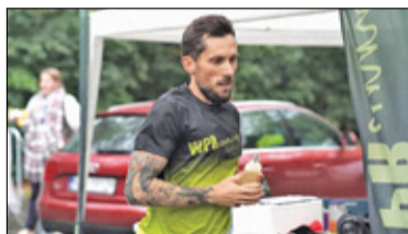
||| Pruszków - 217 kilometrów i eksplozja emocji s. 4