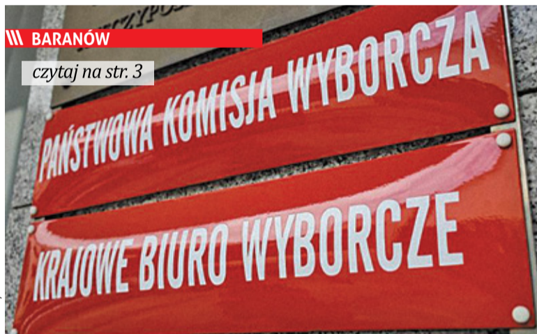
||| BARANÓW czytaj na str. 3

Poprzedni wójt Waldemar Brzywczy został odwołany w referendum 14 czerwca