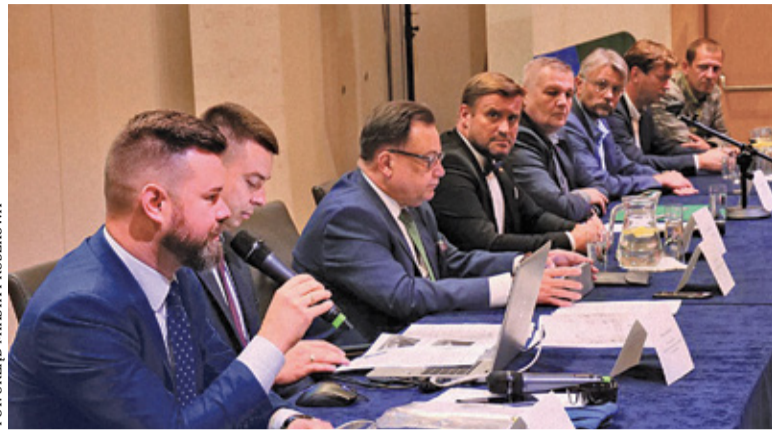
Głównym celem jest usprawnienie ruchu