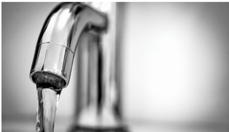
MPWiK zapewnia, że prowadzi działania, aby wyeliminować uciążliwość

Awaria magistrali wodociągowej w Alejach Jerozolimskich na wysokości ul. Popularnej w Warszawie. 13 sierpnia 2020 roku. Mieszkańcy Pruszkowa, Piastowa, Michałowice oraz stołecznych dzielnic Ursus i Włochy zostali bez wody. Wodociągowcy ruszyli do naprawiania awarii. Użytkownicy zostali bez wody na kilkanaście godzin. Ta sytuacja nie była niczym nowym dla mieszkańców Pruszkowa czy Piastowa. Awary magistrali, brak wody w kranach, beczkowsy na ulicach to dobrze znany obraz.